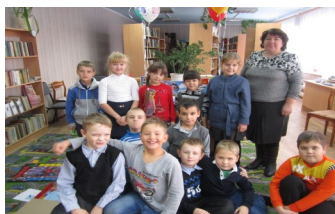
Знакомство с ремеслами

индивидуального чтения» и «Массовая работа».