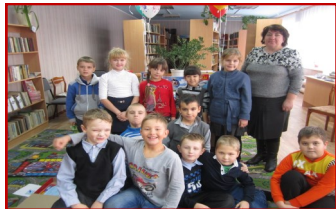
Литературно-игровая программа «Сказки Пушкина читаем – в сказку мы попасть мечтаем»

Цель программы - приобщение детей к чтению через пропаганду детской художественной литературы.