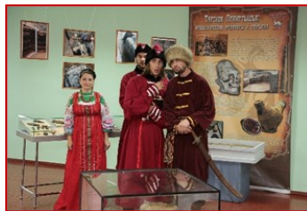
Участники театрализованной экскурсии на археологическом

В итоге мероприятия посетили не менее 2000 зрителей, в том числе туристов (из Омской, Томской, Тюменской областей, ХМАО).