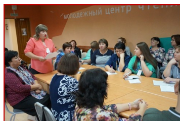
Консультация специалистов по приемам оформления пространства

Мероприятие «Досуговая деятельность как фактор формирования социально культурного пространства малого города» - форум организаторов досуга для подростков и молодежи, проводилось с целью содействия повышению качества организации досуга для подростков и молодежи как одного из средств профилактики асоциального поведения и выполняло поставленные задачи: поиск новых форматов и технологий при организации досуга для детей и молодежи и обмен опытом между участниками форума.