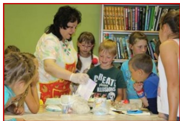
Кулинарная смена. Мастер-класс

Летний отдых в библиотеке стал активным, творческим, познавательным и интересным. Специалисты детской библиотеки для реализации проекта использовали весь свой потенциал и опыт работы по данному направлению. Для реализации проекта были задействованы все помещения детской библиотеки и прибиблиотечная территория.