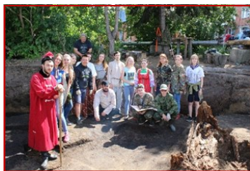
Театрализованные экскурсии на археологическом раскопе

В течение организационно-подготовительного этапа был разработан и установлен информационный баннер, посвященный археологическому наследию города, проведены информационные мероприятия для учащейся молодежи города. В итоге специалистами научно-краеведческого центра районной библиотеки и специалистами сельских библиотек-филиалов для