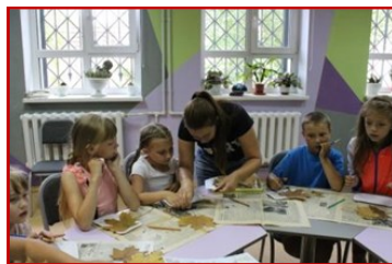
Сельскохозяйственная смена «АГРОуроки».

Удалось наладить контакты с такими организациями, как БУ «Редакция газеты «Тарское Прииртышье», Тарский завод «Кварц», пожарная часть г. Тара, отделом ГИБДД, БУЗОО «Тарская ЦРБ», ГУ «Тарская метеостанция», Тарским участковым