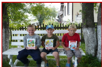
Акция «Семейное чтение»

Целевая аудитория: воспитанники Пологрудовского детского сада, обучающиеся БОУ «Пологрудовская СОШ», молодые семьи.