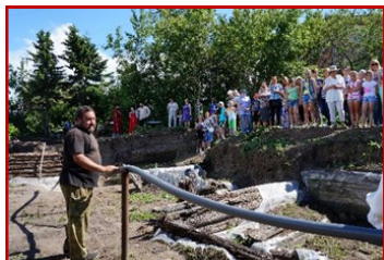
Фрагмент театрализованной экскурсии на археологическом раскопе «Тарская крепость»

Для реализации мероприятий основного этапа был разработан сценарий театрализованной экскурсии, основанный на исторических фактах, происходивших в Таре в XVII веке и проведены репетиции экскурсии.