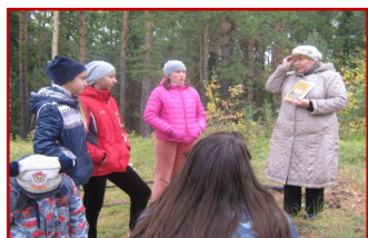
IX Есенинские чтения на

За время работы проекта увеличилось количество пользователей и книговыдачи, в семьях возрождается традиция семейного чтения, тем самым повышается престиж книги, чтения, библиотеки.