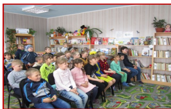
литературный праздник «В гостях у природы»

Данная программа помогает решить ситуацию, сложившуюся в обществе, которая характеризуется падением престижа чтения среди детей.