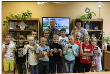
Экологическая смена «ЭКОдом».

посвященная безопасности жизнедеятельности людей, помогла узнать, какие виды профессий данного направления существуют и в чем заключается специфика каждой из них.