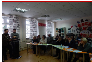
Круглый стол «Особенности организации досуга подростков и молодежи в условиях социально культурной среды малого города»

волонтерской деятельности в учебных учреждениях города, практика социально-значимой проектной деятельности, организация клубов по интересам, организация культурного и интеллектуального (развивающего) досуга в учреждениях культуры. Прошли мастер-классы, тренинги и консультации специалистов по приемам оформления пространства для проведения массовых мероприятий, ознакомление с правовыми основами организации и проведения мероприятий, основам актерского мастерства и использования элементов театрализации. Два мастер-класса были посвящены формированию культуры здорового образа жизни в общей структуре свободного времени – это мастер-класс по йоге и пилатесу.