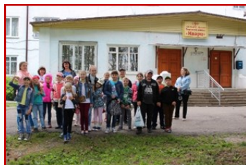
Смена рабочих профессий. Пешеходная экскурсия на