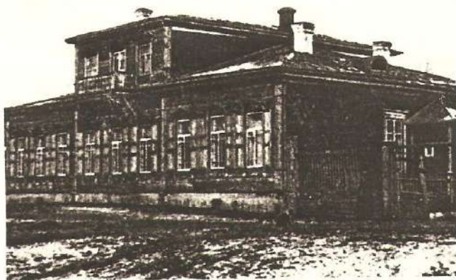
Дом градоначальника в Кяхте. Фото кон. XIX в.

В статье использованы иллюстрации из путеводителя «Кяхта. Памятники истории и культуры», составитель Е.Е.Потова. – М., 1990.