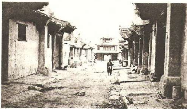
Улица в Маймачене. кон. 1890 — нач. 1900 гг.

Вторым большим делом графа Рагузинского стали переговоры с Китаем. Они шли медленно. Постепенно преодолевались одна за другой существовавшие и искусственно возводимые китайской стороной дипломатические преграды. В результате Рагузинскому удалось в августе 1727 г.