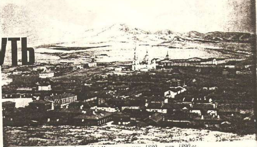
Торговая слобода Кяхта. кон. 1880 — нач. 1890 гг.