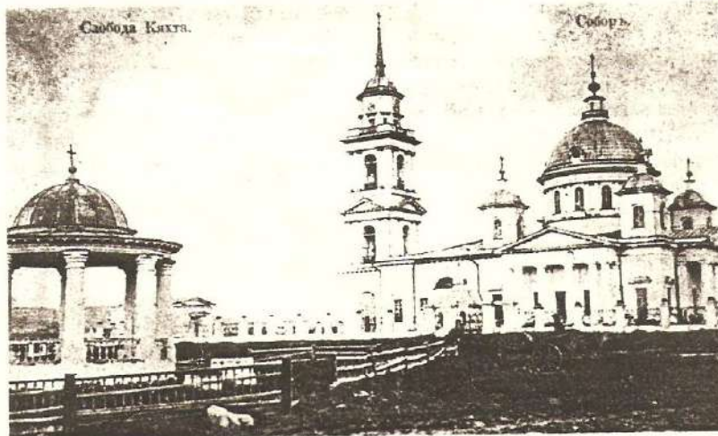
Воскресенская церковь в Кяхте. нач. 1900-х гг.