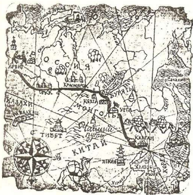
Чайный путь Калган — Ирбит.

Торговая слобода располагалась в 4 верстах от крепости. Кяхте суждено было стать поселком миллионеров. Но произошло это не в одночасье. Согласно утвержденным 19 марта 1854 г. правилам для водворения в торговой слободы и "пропуска туда разного звания людей", проживать постоянно могли: а) лицо, состоящее там на службе; б) торгующее на Кяхте купечество и купеческие приказчики и поверенные; в) лица, занимающиеся теми или иными дозволенными законом промыслами, для благосостояния слободы необходимыми; г) все вообще, имеющие в слободы недвижимую собственность, хотя бы и не принадлежали к трем первым разрядам; д) семейства всех сих лиц и состоящая при них прислуга...". Параграф 2 называл условие, согласно которому в торговой слободы могли жить люди "всякого другого класса", "только с согласия местного купечества". Об этом кяхтинским купеческим обществом должен был приниматься специальный приговор, утверждавшийся градоначальником. Проникновение в слободу самих жителей (а их было немного) не было особенно затруднено. В любое время они легко пропускались через заставу из слободы и обратно. Практически все служащие и чиновники знали их в лицо. Приезжавшие на время гости и иногородние получали от полиции, с разрешения градоначальника, месячные, полугодовые или годовые би-