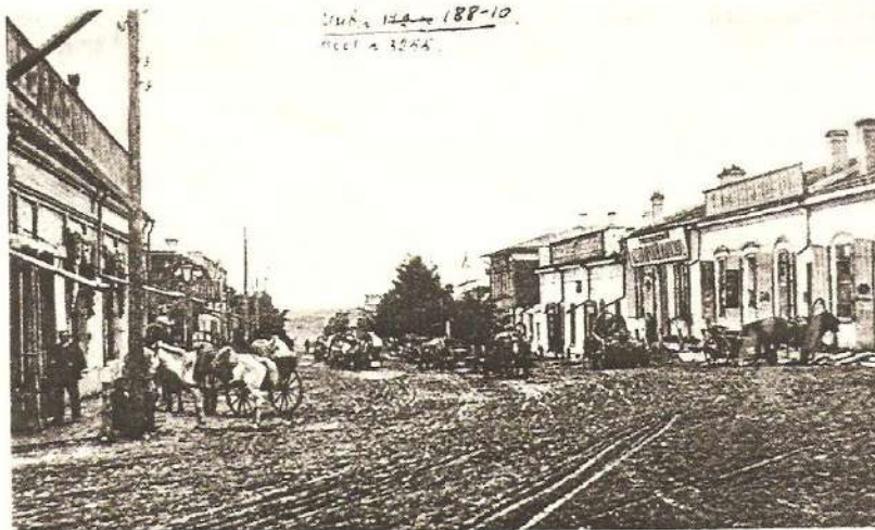
Большая улица в Троицкосавске. Фото А.Порфирьева, нач. 1900-х гг.

Упаковкой (ширкою) чаев занимались специальные ширельные артели. До перевода таможи из Кяхты в Иркутск в 1861 г. это делала одна артель из 130-150 человек. Таможенная инвалидная артель избирала старшину, которого утверждал директор таможи. Позже купцы начали заводить собственные артели. Их стало с десяток, по числу фирм. В каждой было от 10 до 50 троицкосавских мещан. С приходом каравана или обозов, осмотренные и два раза взвешенные места, тюки чая, перевозились из гостиного двора и сдавались артельщикам. За день до работы ширельщикам в специально построенные казармы, длинные одноэтажные деревянные бараки, доставлялись вымоченные воловьихи кожи. "Расходчик" раз-