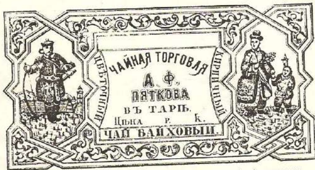
Чайная торговля А.Ф.Пяткова в Таре. Этикетка чайной упаковки

Раздвигая рамки темы, попробуем посмотреть на проблему через краткую характеристику конкретных участников событий и всего того, без чего в то время не могла состоять чайная торговля.